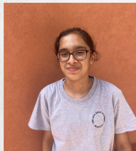
Marine - 30 de Março